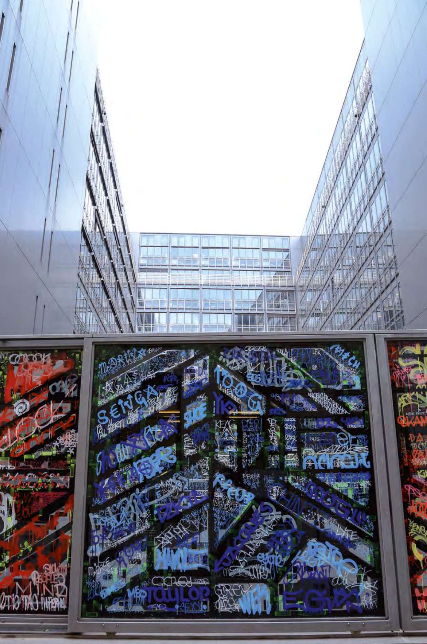
Oxymores, exposition-intervention au ministère de la Culture, O'Clock, Lek et Sowat, 2015