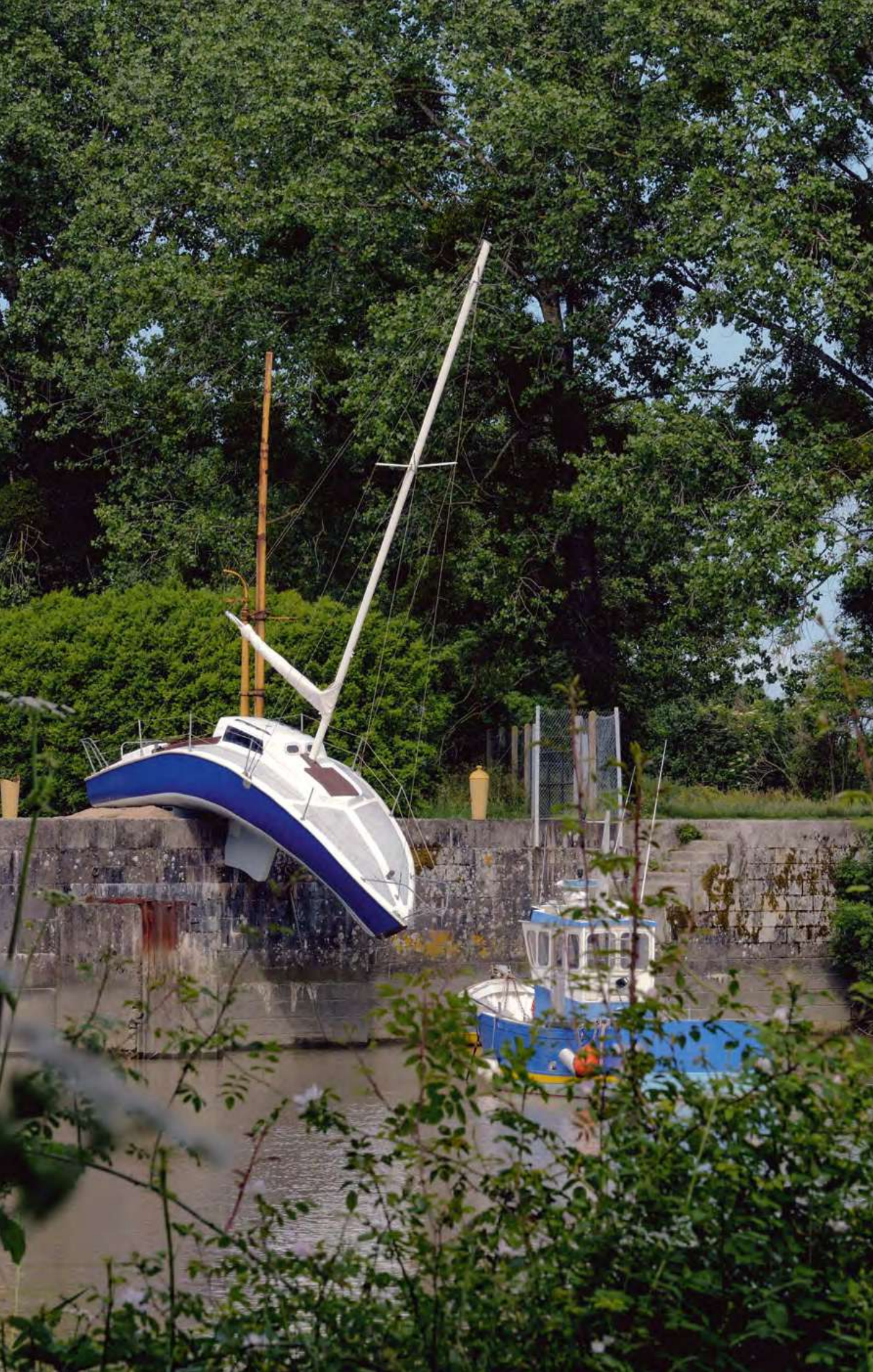
Misconceivable , Erwin Wurm, Canal de la Martinière, Le Pellerin, création pérenne Estuaire, 2007