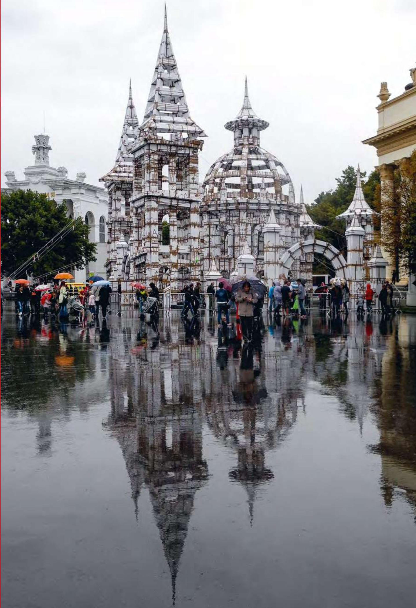
Installation monumentale d'Olivier Grossetête, Moscou, 2015 © Olivier Grossetête