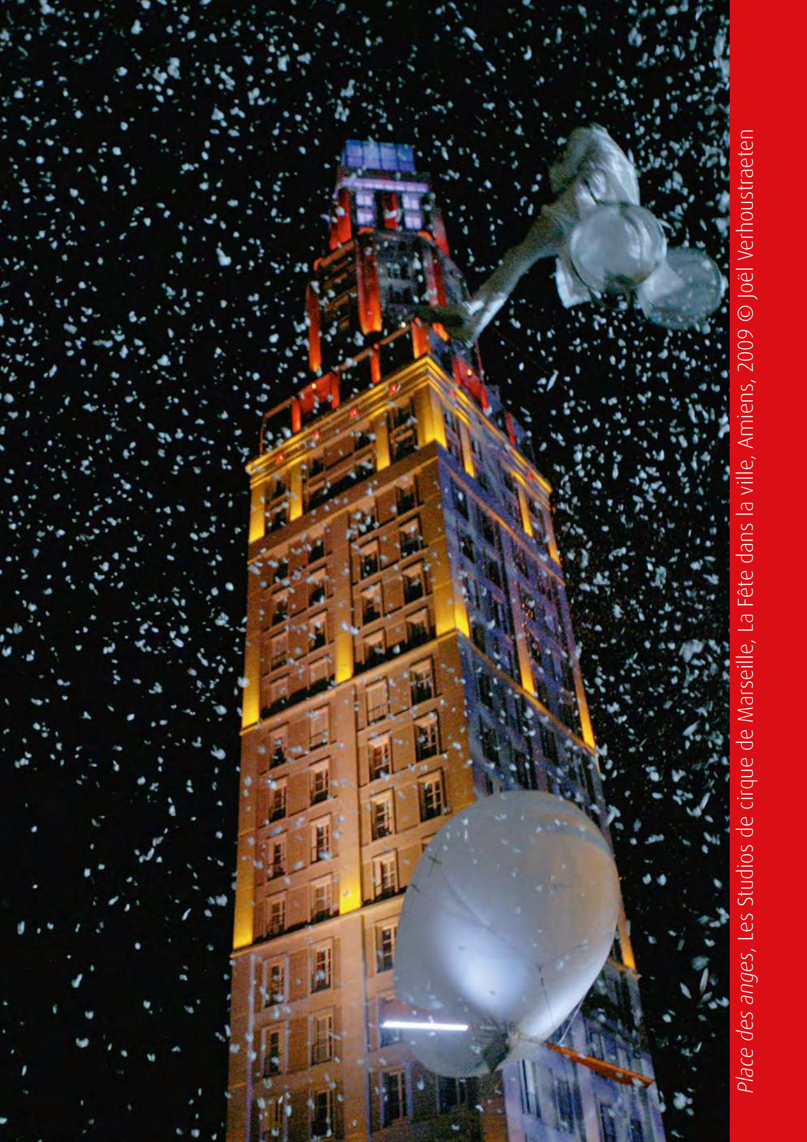
Place des anges, Les Studios de cirque de Marseille, La Fête dans la ville, Amiens, 2009