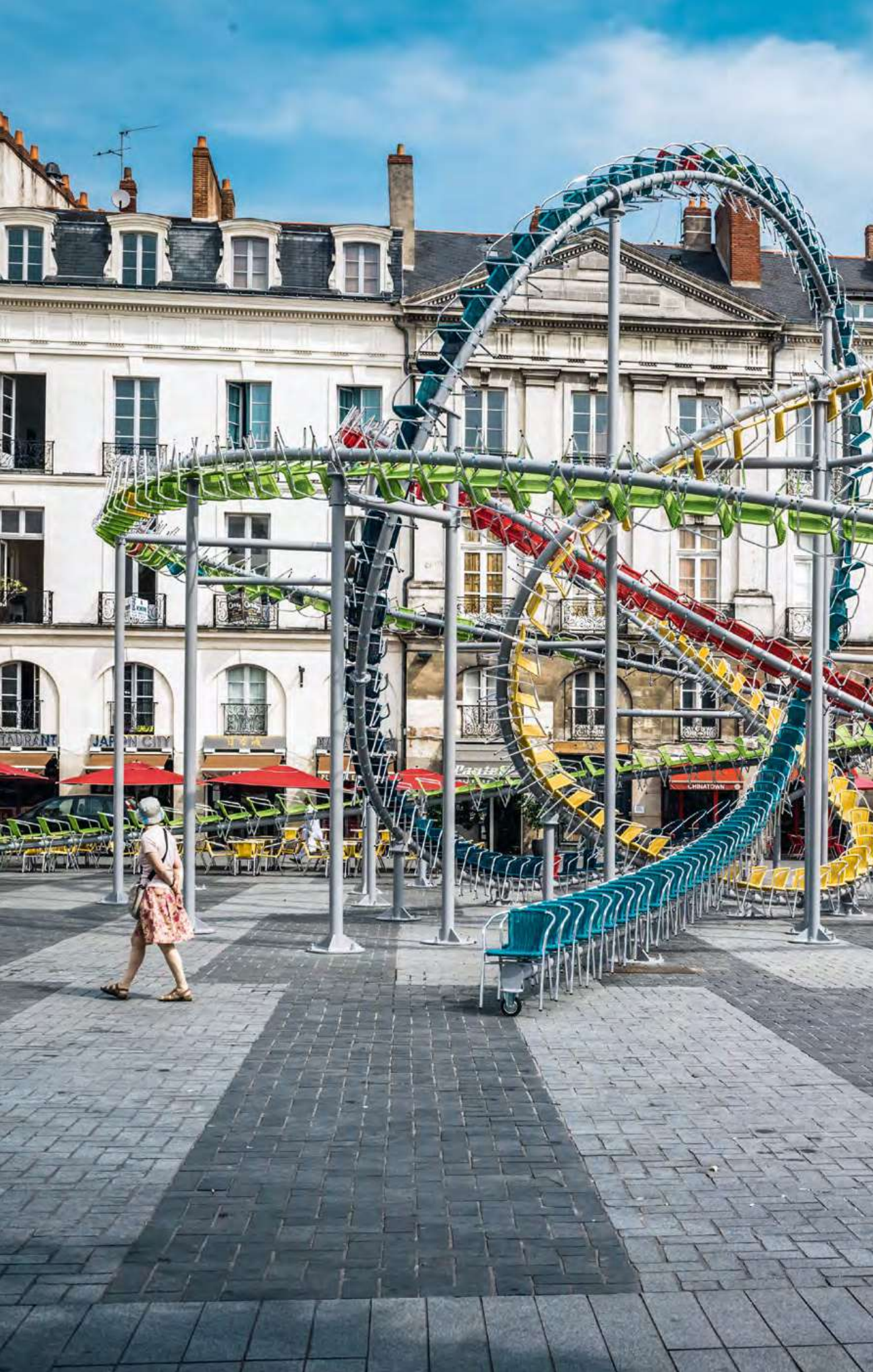
Stellar, Baptiste Debombourg, place du Bouffay, dans le cadre du Voyage à Nantes, 2015